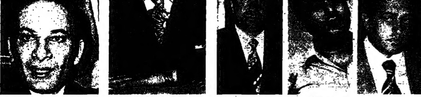
فؤاد الحدود ■

الاجماع العالى في المجلس النيابي في بيروت، الذي اجتمع في جلسة استثنائية في ١٠ كانون الاول ١٩٧٧، قد اتفق على دعم الموقف العربي في مواجهة التطورات الملاحقة على الصعيد العربي.